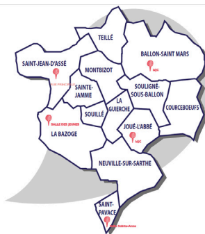
Navette A : départ du collège de Sainte-Jamme à 16h30 Navette B : départ du collège de Ballon à 17h30

Les Espaces Jeunes sont des lieux de détente, de convivialité et de partage ouverts aux jeunes à partir de la 6ème. Il existe 5 EJ sur le territoire.